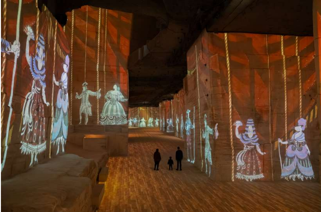
Expérience immersive « Picasso, l'art en mouvement » aux Carrières des Lumières - Les Baux-de-Provence © Succession Picasso 2026

Après la peinture, le parcours dévoile le talent scénographique de l'artiste, curieux d'explorer de nouveaux univers. En 1916, Jean Cocteau permettra la rencontre avec Serge de Diaghilev, célèbre directeur des ballets russes, pour qui Picasso dessine et participe à la création de décors et costumes pour différentes pièces. Le rideau de scène de Parade crée l'illusion d'un théâtre. De dimensions colossales, 10 par 16 mètres, il fut montré, lors de la première, au théâtre du Châtelet en 1917. Depuis les cintres d'une cage de scène imaginaire, les décors sont chargés et se succèdent, avant de laisser place aux acteurs en costumes dessinés par l'artiste.