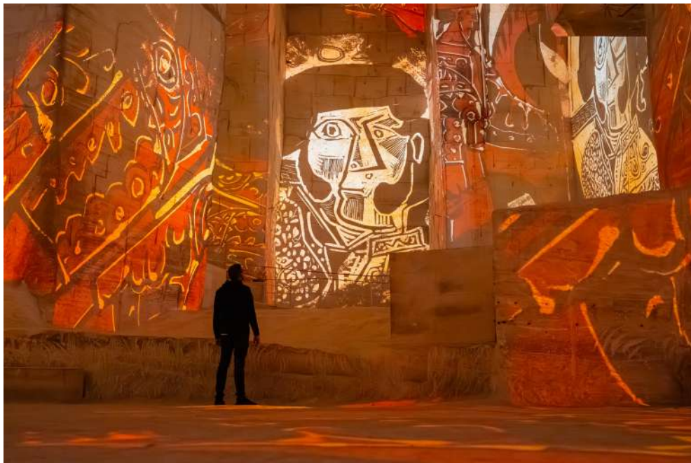
Expérience immersive « Picasso, l'art en mouvement » aux Carrières des Lumières - Les Baux-de-Provence © Succession Picasso 2026

Le thème musical des Asturias composé par Isaac Albéniz, agite les muletas avant que le mouvement du trait vif du pinceau de Picasso ne transperce la toile, comme une épée au cœur de la lutte, entre la vie et la mort.