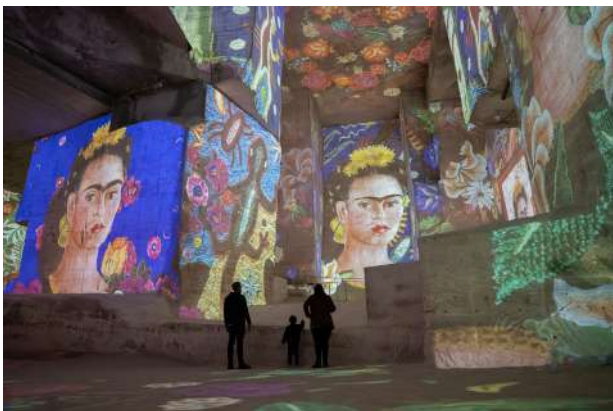
Expérience immersive « Frida Kahlo, en plein cœur » aux Carrières des Lumières - Les Baux-de-Provence

Au fil des projections monumentales, les parois des Carrières des Lumières se métamorphosent au rythme de la vie de Frida : de ses premières œuvres marquées par la souffrance physique et la quête de soi, à ses tableaux les plus affirmés où éclatent la puissance de son identité et de son engagement. Les motifs végétaux, organiques et anatomiques s'animent, traduisant l'évolution d'une artiste qui a transformé la douleur en art, la fragilité en force, l'intime en universel.