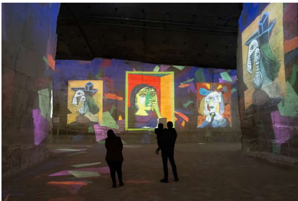
Expérience immersive « Picasso, l'art en mouvement » aux Carrières des Lumières - Les Baux-de-Provence © Succession Picasso 2026

Du réalisme au surréalisme, de l'amour à la séparation, de la muse à l'oubliée, les femmes de sa vie sont ici enveloppées par la voix de la chanteuse Celeste, questionnant l'évolution des rencontres : « Isn't it strange - How people can change - From strangers to friends - Friends into lovers - And strangers again ? ». Elles ne cesseront jamais d'inspirer et d'influencer l'évolution picturale de l'artiste tout au long de sa carrière.