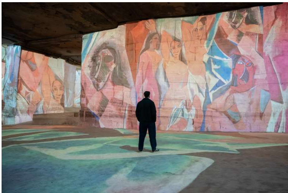
Expérience immersive « Picasso, l'art en mouvement » aux Carrières des Lumières - Les Baux-de-Provence © Succession Picasso 2026, crédit photo : © Culturespaces/Vincent Pinson

Peint en 1907, ce chef-d'œuvre est d'abord incompris, voire jugé choquant par ses contemporains. Il marque une rupture radicale avec les normes académiques. Picasso compose avec une absence de perspective, les corps de cinq femmes, qui sont d'abord déconstruits, puis transformés par une géométrisation des volumes qui les rendent anguleux et asymétriques. Leurs visages parfois de face avec un nez de profil, s'apparentant à des masques venus d'ailleurs.