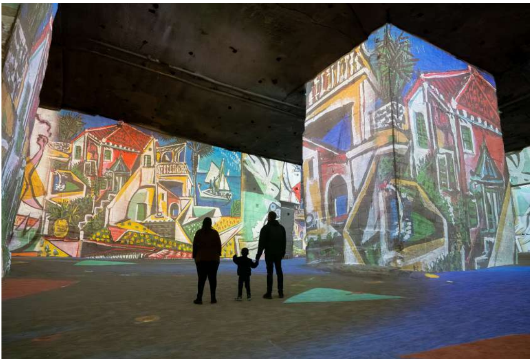
Expérience immersive « Picasso, l'art en mouvement » aux Carrières des Lumières - Les Baux-de-Provence © Succession Picasso 2026

Le jour se lève ensuite, bercé par le son des vagues. La vision unique de Picasso capture ses instants, où baigneuses et baigneurs flânent, comme Deux Femmes courant sur la plage de 1921. Au fur et à mesure de l'évolution artistique de Picasso, les sujets deviennent des créatures semblant irréelles. Les dernières baigneuses, dont les masses se superposent dans un équilibre improbable sont surprenantes, comme de véritables sculptures sur la toile.