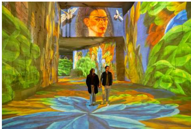
Expérience immersive « Frida Kahlo, en plein cœur » aux Carrières des Lumières - Les Baux-de-Provence

Présentée en programme court, à la suite de l'expérience immersive Picasso, l'art en mouvement , cette création offre un contrepoint sensible et introspectif, où chaque image révèle la force intérieure et la poésie visuelle de Frida Kahlo. Identité, douleur et passion s'entrelacent dans un voyage sensoriel où chaque image semble palpiter au rythme du cœur de Frida.