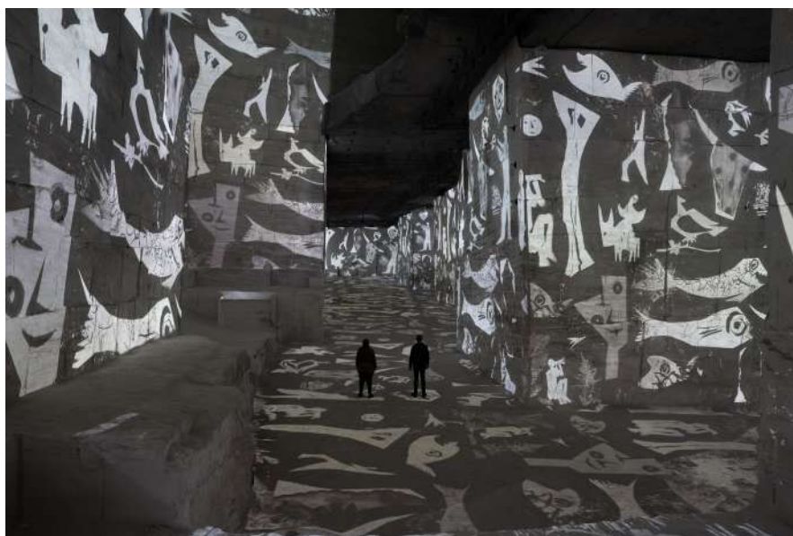
Expérience immersive « Picasso, l'art en mouvement » aux Carrières des Lumières - Les Baux-de-Provence © Succession Picasso 2026

Immergées dans cette palette en noir et blanc qui accompagnent le défilement de photographies, les œuvres permettent d'observer de nombreux procédés explorés par l'artiste. Le visiteur découvre entre autres, la technique de surimpression créée avec le photographe André Villers, autour de plusieurs études en série, parmi lesquelles celle de La Chèvre , dont les variantes s'étalent sur les parois des Carrières. Les découpes au linoléum contrastées cisèlent les murs d'un blanc perçant, les contours du visage de Françoise Gilot se révèle sur fond noir, ou encore les courbes peintes de l'Atelier de la modiste de 1926, qui offrent tout un nuancier à cet univers monochrome. Sur le rythme cadencé de I feel free du groupe de rock Cream, le visiteur est lancé dans l'aventure artistique de Picasso, au cœur de la dualité entre le noir et le blanc.