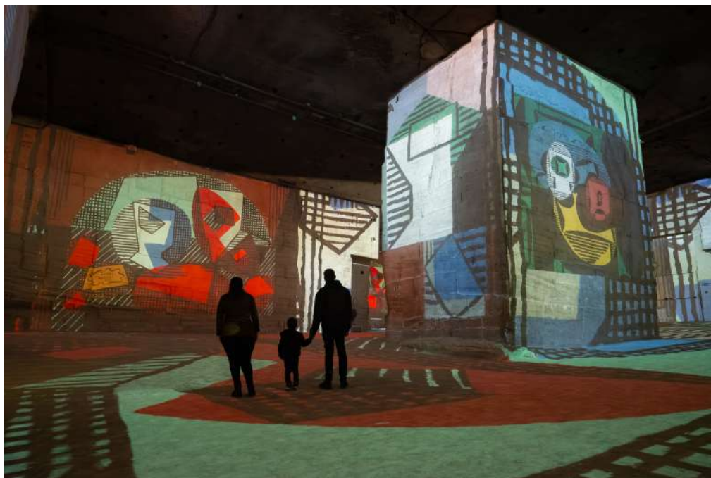
Expérience immersive « Picasso, l'art en mouvement » aux Carrières des Lumières - Les Baux-de-Provence © Succession Picasso 2026

Enfin, les œuvres en papiers collés se construisent sous les yeux du visiteur, dans lesquelles même une corde peut s'enrouler pour devenir un cadre. Dans cet élan de contestation des normes académiques, Picasso réintègre des éléments du quotidien, et colle des fragments de réalité qui attirent le regard ou trompent l'œil sur la toile. Après l'exploration des papiers collés qui influenceront sa manière de peindre, le visiteur découvre des œuvres peintes. Comme un héritage de l'exploration par le collage, l'œuvre Les Trois musiciens de 1921, est composée de couleurs vives semblant se superposer sur la toile.