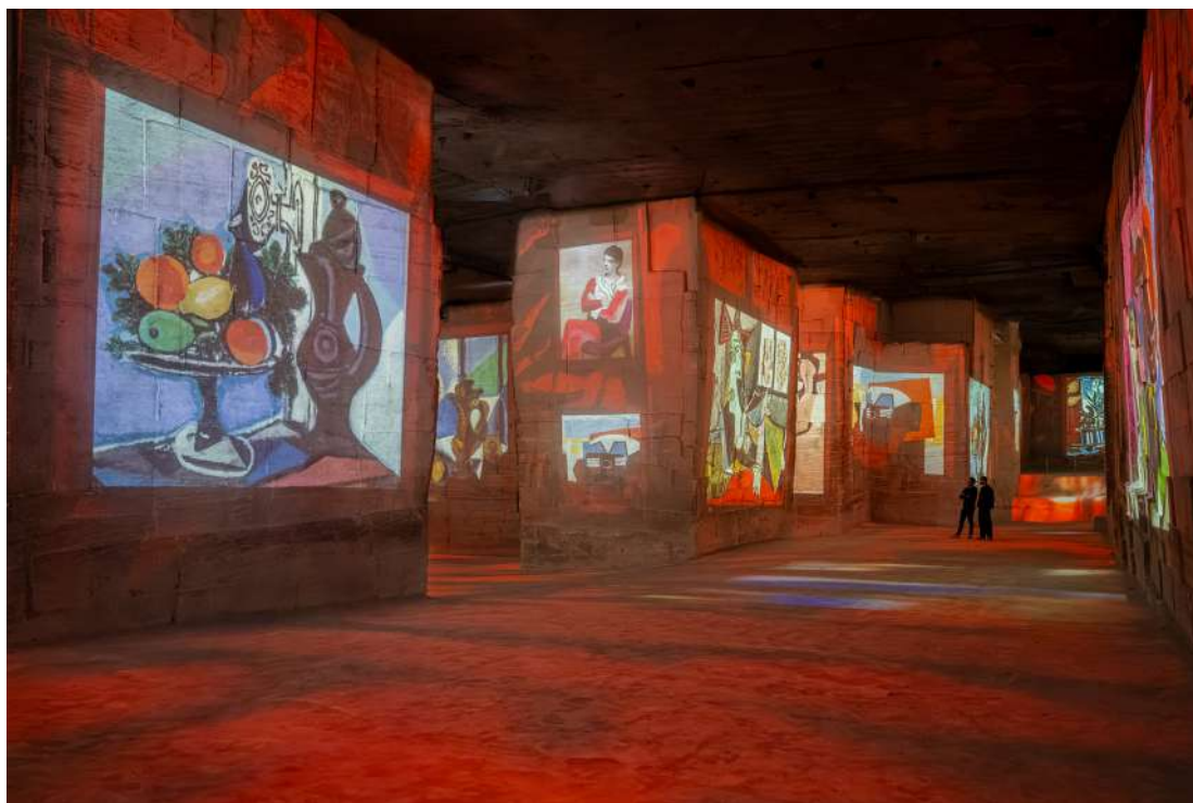
Expérience immersive « Picasso, l'art en mouvement » aux Carrières des Lumières - Les Baux-de-Provence © Succession Picasso 2026

Les couleurs dominantes irradiant les appartements qui défilent sous les yeux du visiteur, comme Le Profil féminin de 1959 de son fond rouge, avant que la dernière lumière ne s'éteigne sur la Femme lisant de 1935 à la tombée de la nuit.